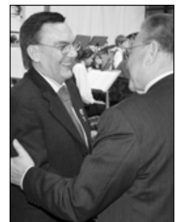
Dir. Frieder Konrad