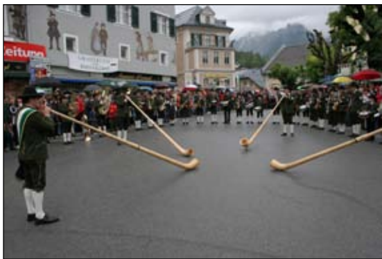
Unsere Alphörner durften auch in Bad Aussee nicht fehlen