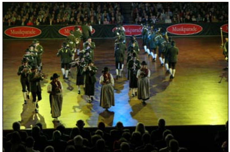
Von Nervosität keine Spur: die einstudierten Formationen klappten perfekt!

„Superbe, Autriche!“ Dieses Urteil des Generaltruppeninspektors für die französischen Militärkapellen, sowie der Applaus der insgesamt 11.000 Zuseher bestätigten, dass unser junges Amateursorchester (unser Altersschnitt liegt bei 19 Jahren)