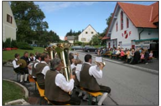
Dorffest mit der Feuerwehr in Großfelgitsch