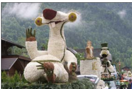
Wir begleiteten den Zug der phantasievollen Narzissengebilde musikalisch durch die ganze Stadt.

Viele weitere Bilder finden Sie auf unserer Homepage www.marktmusik-heiligenkreuz.at