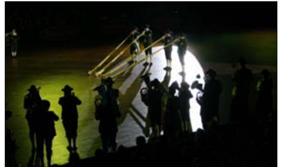
Unsere Alphornbläser im Rampenlicht