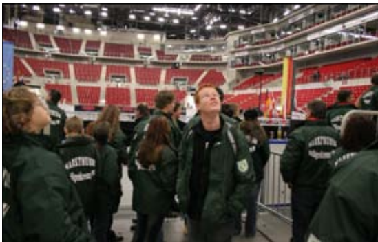
Beeindruckende Dimensionen: der ISS-Dome in Düsseldorf - ein Drittel der 15.000 Plätze war beim Auftritt besetzt