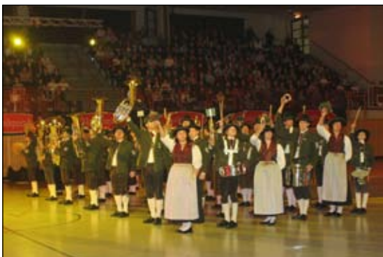
Viermal hieß es: "Servus, Saarbrücken (Düsseldorf/ Würzburg)!"

Für unsere Marktmusik gab es am Beginn dieses Jahres ein besonderes Erlebnis: Die Teilnahme an der großen internationalen „ Musikparade der Militär- und Blasmusik “ in Deutschland vom 26.-28. Jänner 2007. Bei vier Auftritten in den Städten Saarbrücken, Düsseldorf und Würzburg konnten wir ein Wochenende lang als österreichischer Vertreter neben Orchestern aus Holland, Polen, Schottland, Deutschland, Frankreich und der Ukraine auftreten.