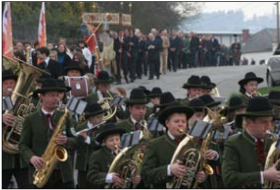
Mit der Auferstehungsprozession am Ostersonntag beginnen unsere jährlichen Ausrückungen in der Pfarre.