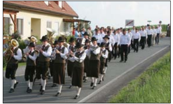
St. Ulrich - Einweihung des Josef Geister-Weges