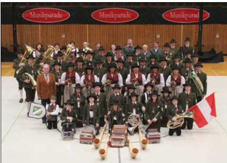
Die erfolgreichen TeilnehmerInnen an der Musikparade. Dass wir für nächstes Jahr (in anderen Städten) wieder eingeladen wurden, freut uns sehr.

Viele weitere Bilder finden Sie auf unserer Homepage www.marktmusik-heiligenkreuz.at