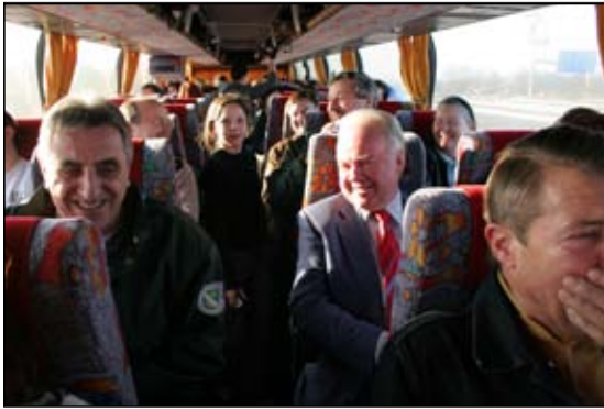
Teil des Showbusiness: Hunderte von gefahrenen km