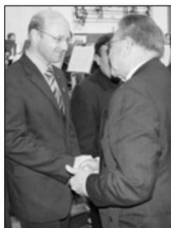
Dir. Alois Kreiner